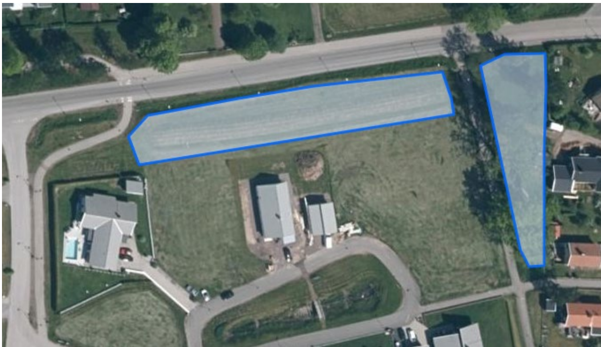
9. Falköpingsv. ca 1900m 2 + 10. Hemvägen ca. 1100m 2