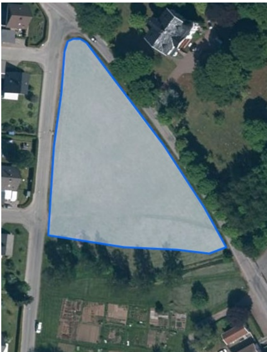
6. Strömsdalsvägen-Skogsvägen ca. 5000m 2