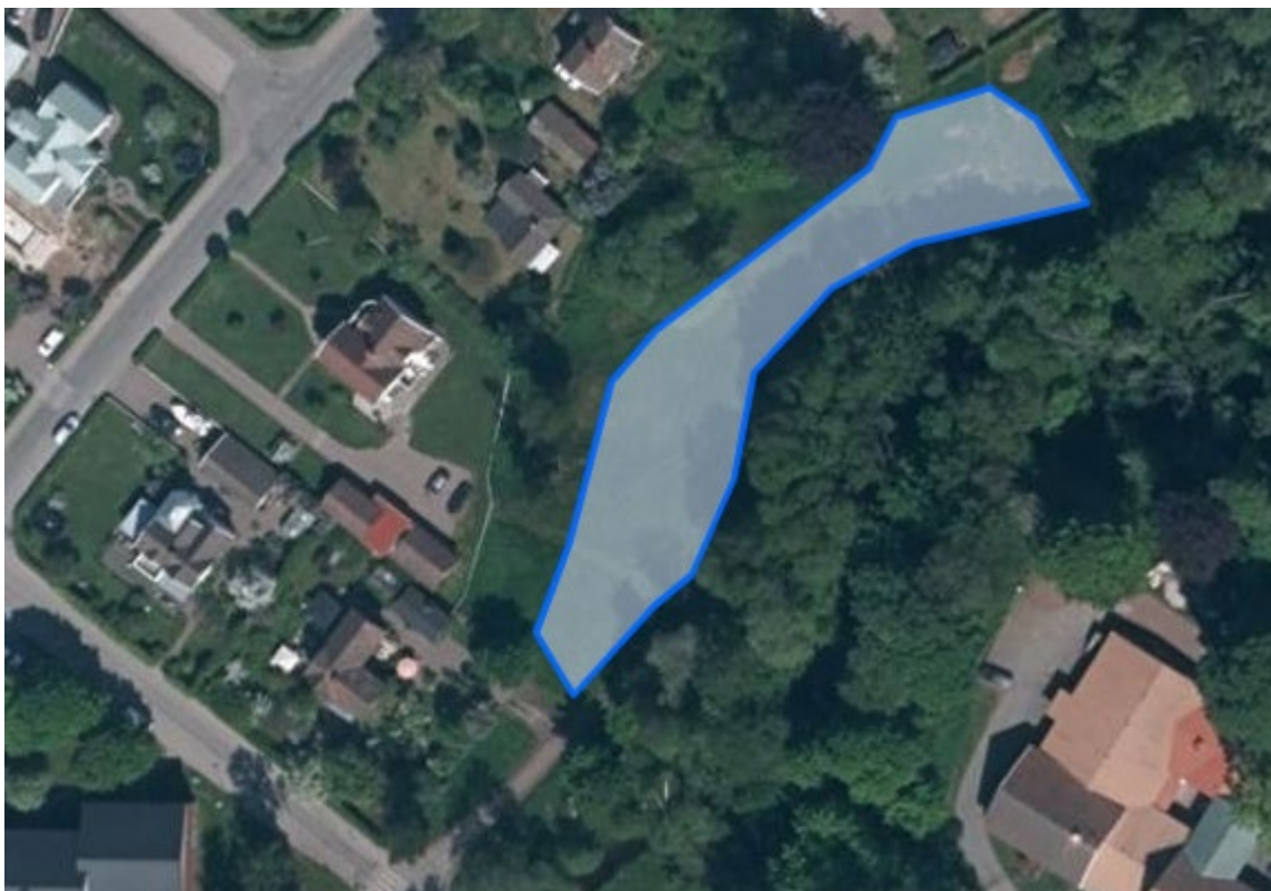
1. Maden Ådalsvägen, vår exempeläng intill Hjoåns dalgång, ca 1600m 2