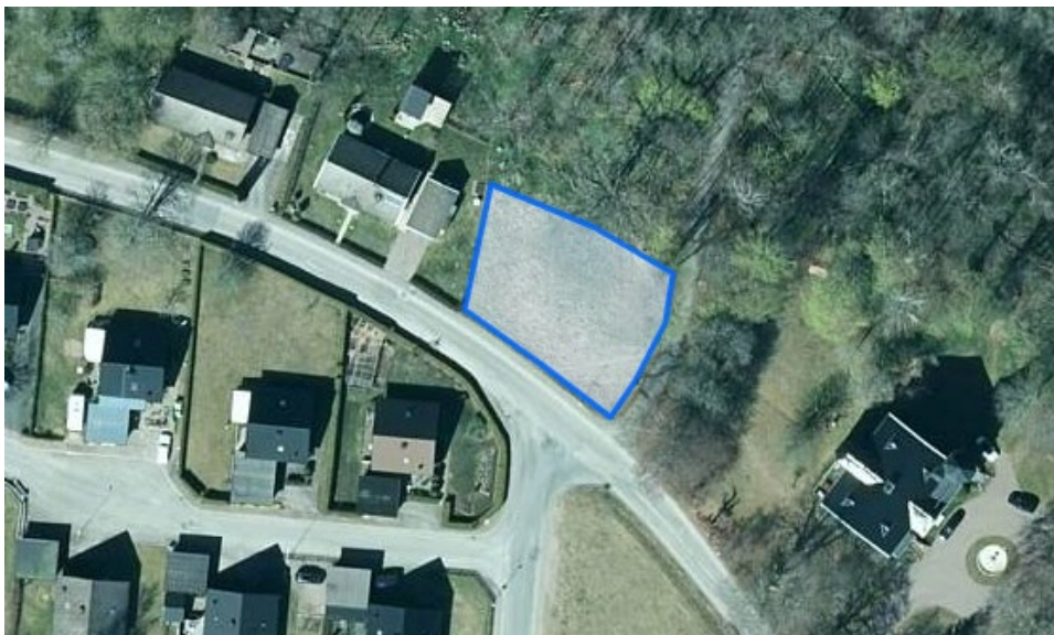
5. Knivsmedsbacken mot Hjoån 800 m 2