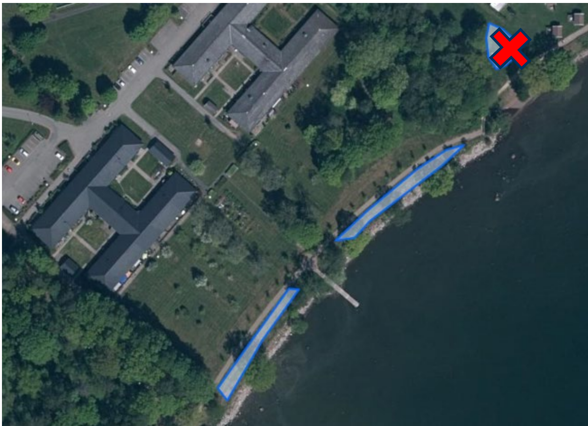
3. Greve Posses allé ca.600m 2