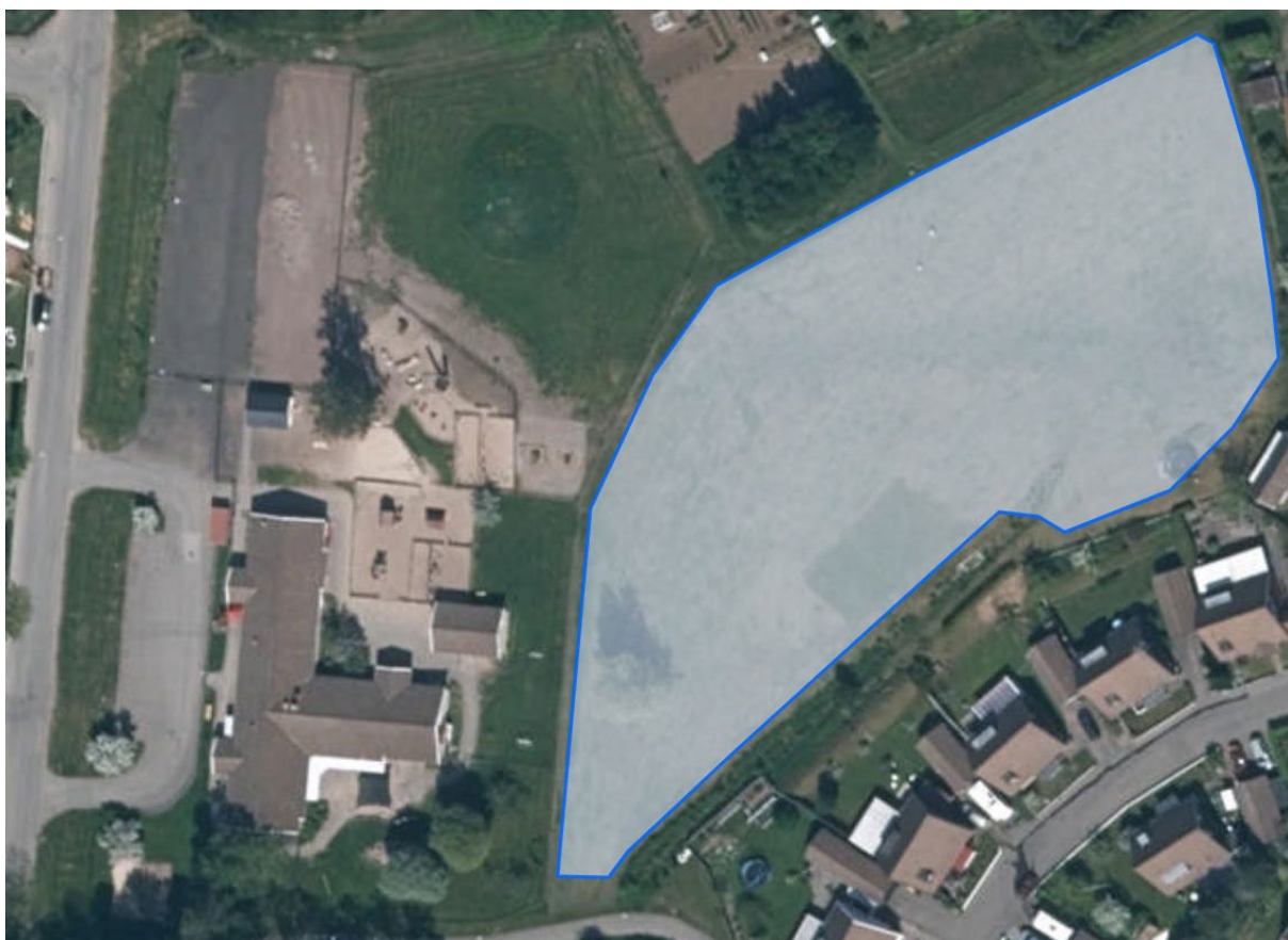
7. Skogshyddan ca 5600m 2