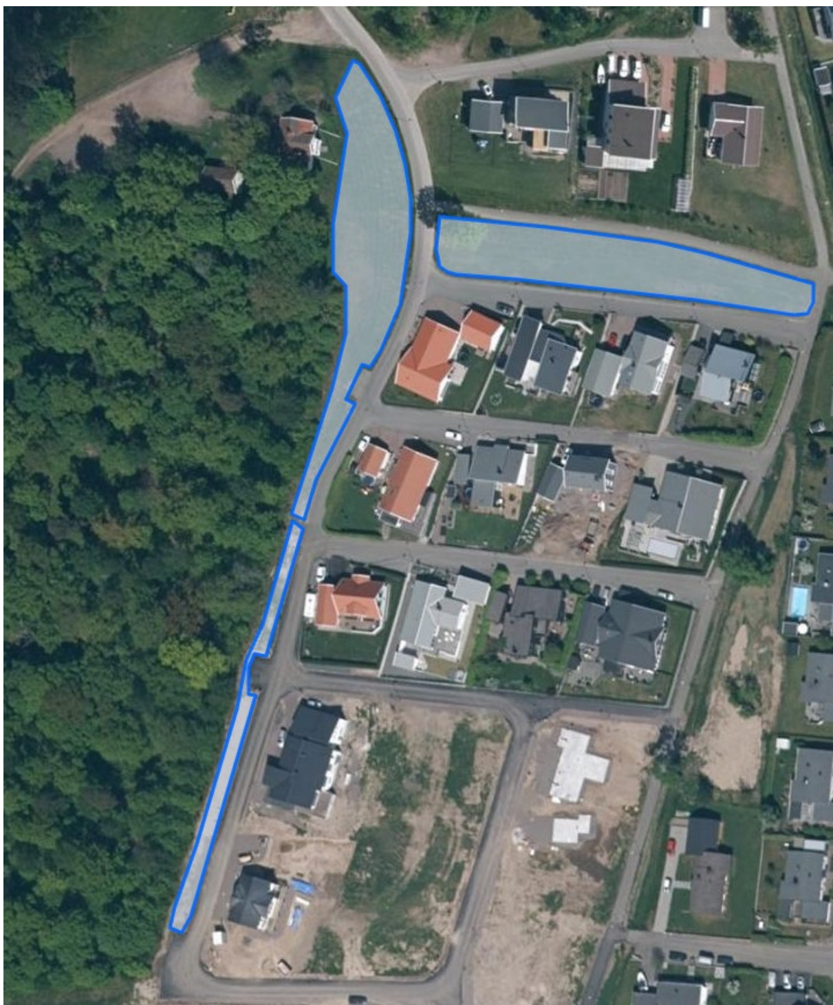
8. Sigghusberg (Estrid Ericssons gata och Harald Larssons gata) ca 2000 m 2 + ca 1400 m 2 =Totalt 3400 m 2