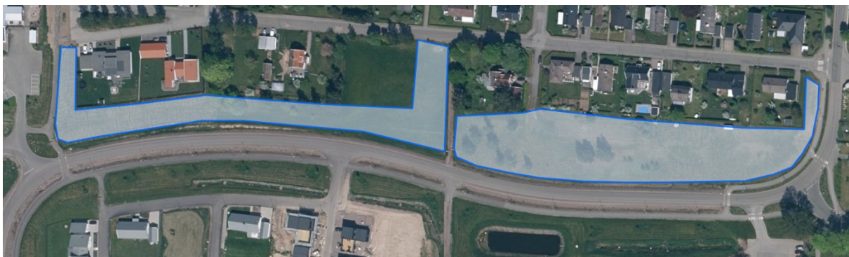
11. Lars i Knäpplansväg ca. 5200m 2 + ca.7800m 2