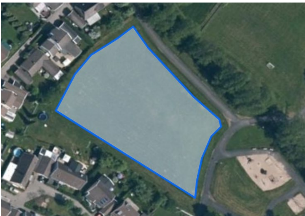
4.Hammarsjorden ca. 3500m 2